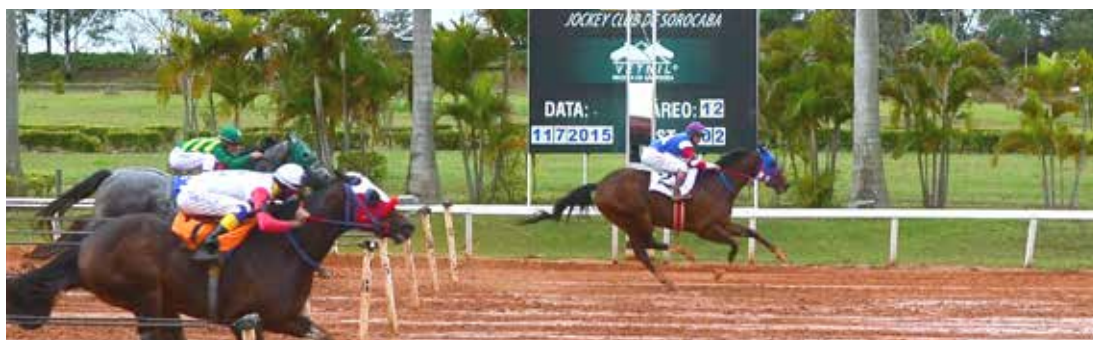
GUAPA GRANITE . AAAT-105 . R$630.800,00 - CAMPEÃ BRAZILIAN FUTURITY E GP POTRO DO FUTURO