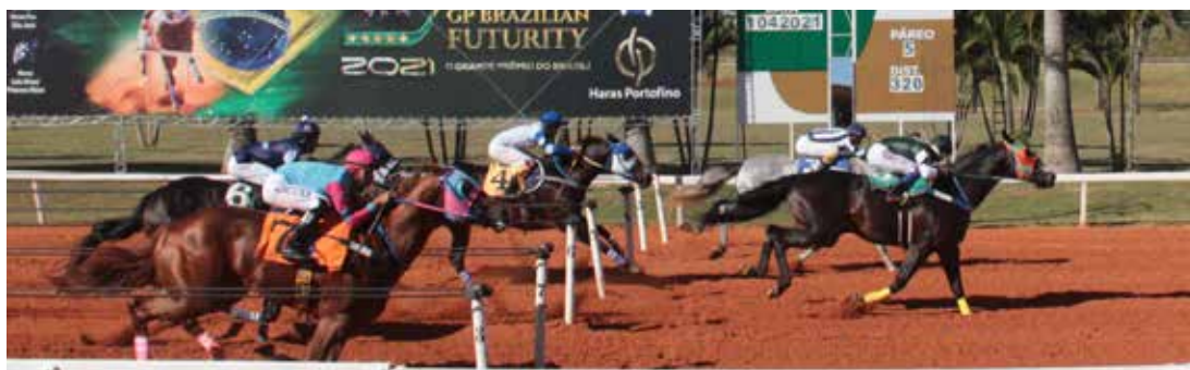
PARTY HARD . AAA-94 . R$482.736,84 - CAMPEÃO GP BRAZILIAN FUTURITY