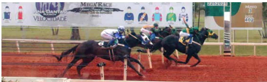
SPLENDIDO . AAA-96 . R$320.092,00 - CAMPEÃO GP MEGARACE