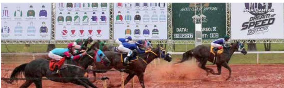
TAU JQM . AAAT-100 . R$579.032,86 – CAMPEÃO GP MEGARACE E GP POTRO DO FUTURO