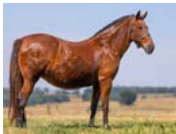
RECEPTORA: 08 RCM