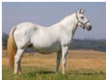
RECEPTORA: 680 STM