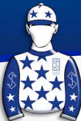
HARAS SÃO JOSÉ