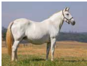
RECEPTORA: 680 STM