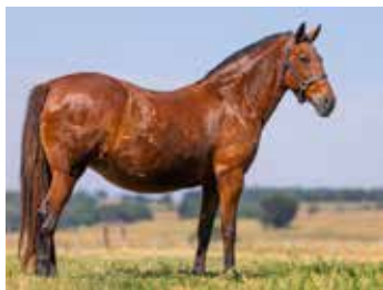
RECEPTORA: 08 RCM