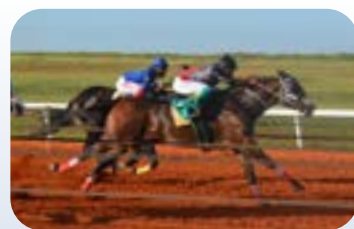
LILICA FANTASTIC STM AAA-90

• CAMPEÃ GP JOCKEY CLUB DE SOROCABA – TORNEIO INÍCIO, CAMPEÃ GP AMÉRICA FUTURITY);