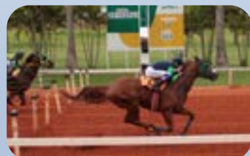
FANTASTIC FEATURE (AAAT-106 / R$499.321,44)