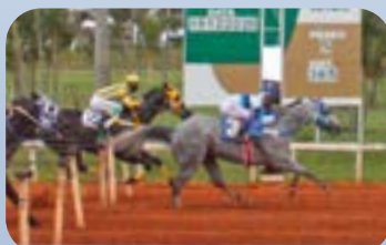
FANTASTIC FLY APOLLO (AAAT-111 / R$ 536.859,00)