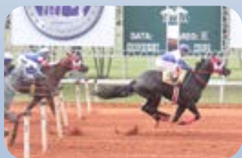
BABY FANTASTIC (AAAT-107 / R$480.602,03)

• CAMPEÃ GP JOCKEY CLUB DE SOROCABA – TORNEIO INÍCIO, CAMPEÃ GP AMÉRICA FUTURITY);