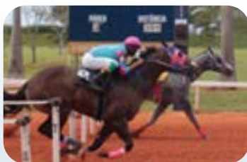
SIMBA FANTASTIC STM AAA-98